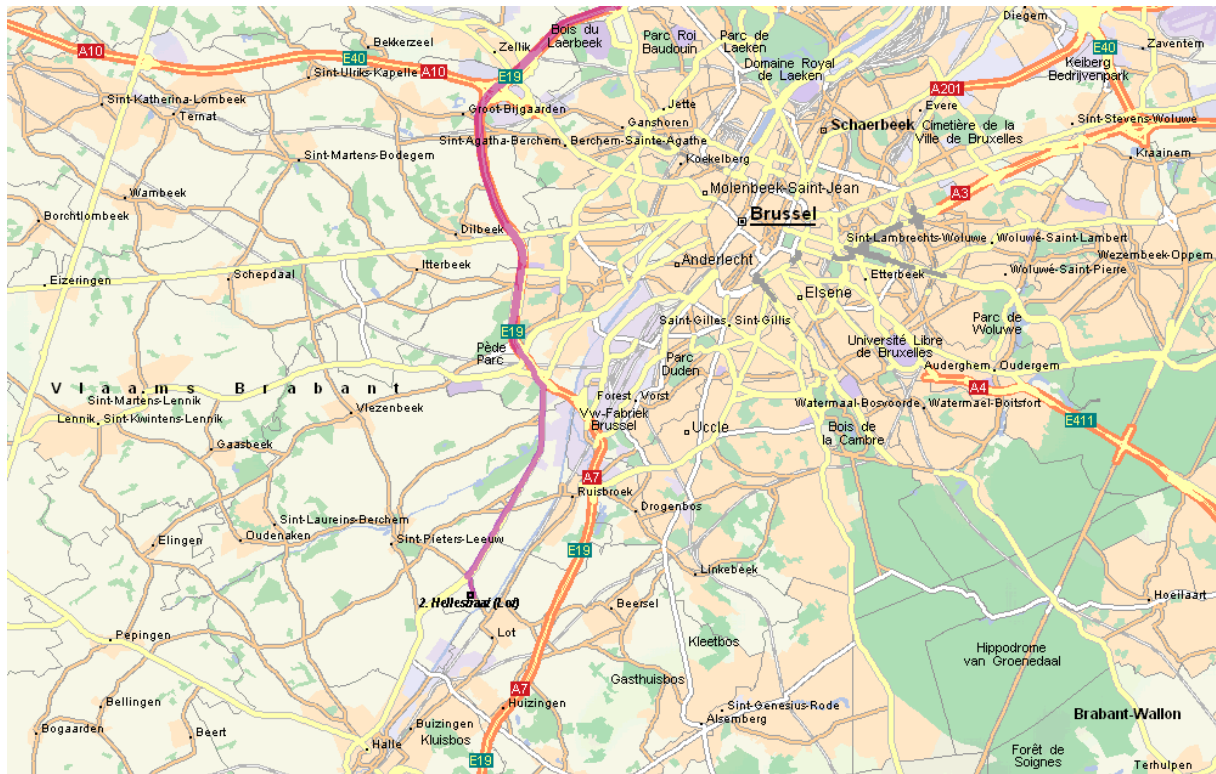
Afbeelding 1: Laeklinde – West - Algemeen