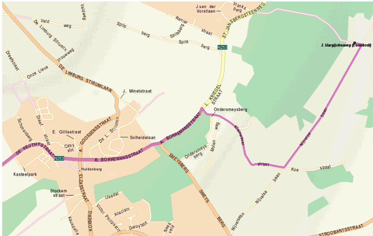
Afbeelding 2: Loonberg – 0405 – Detail