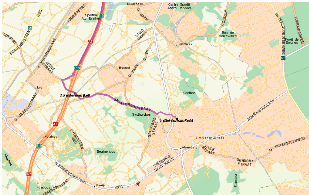
Afbeelding 1: Rondenbos – West - Algemeen