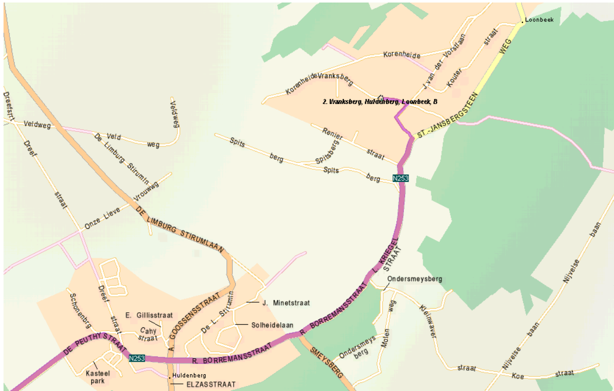
Afbeelding 2: Vrankenberg – Detail